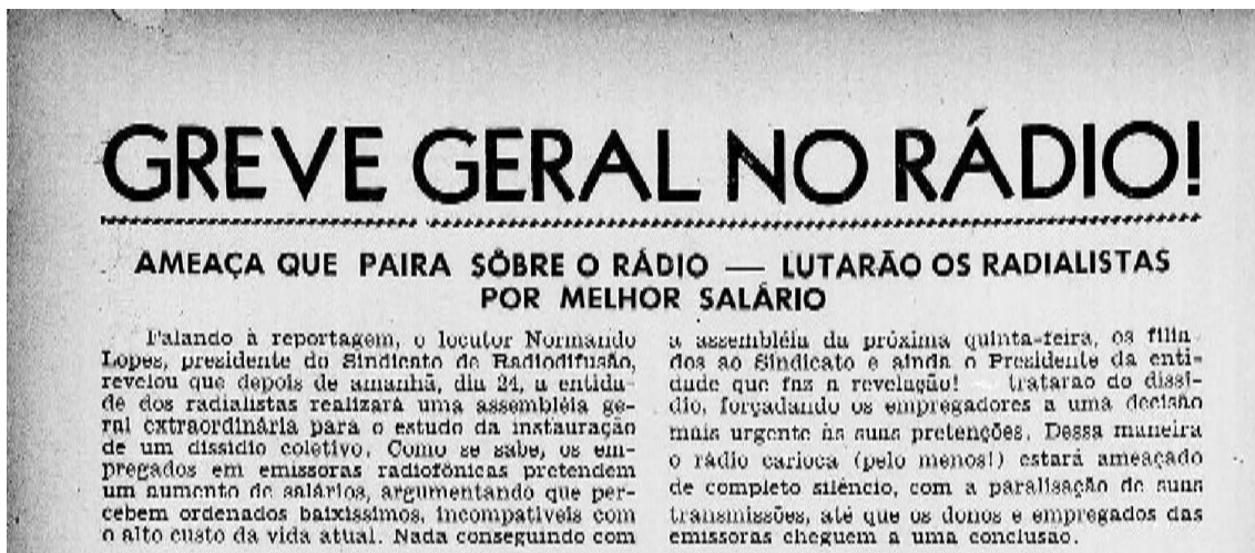
Imagem 3: Notícia sobre uma suposta greve geral dos radialistas, n. 150, 1952.