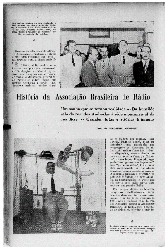
Imagem 2: Trecho da reportagem sobre a história da Associação Brasileira de Rádio, n. 65, dezembro de 1950.