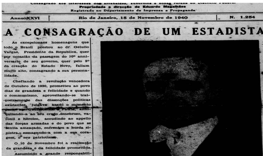
Imagem 03. Reportagem “A Consagração de um estadista”