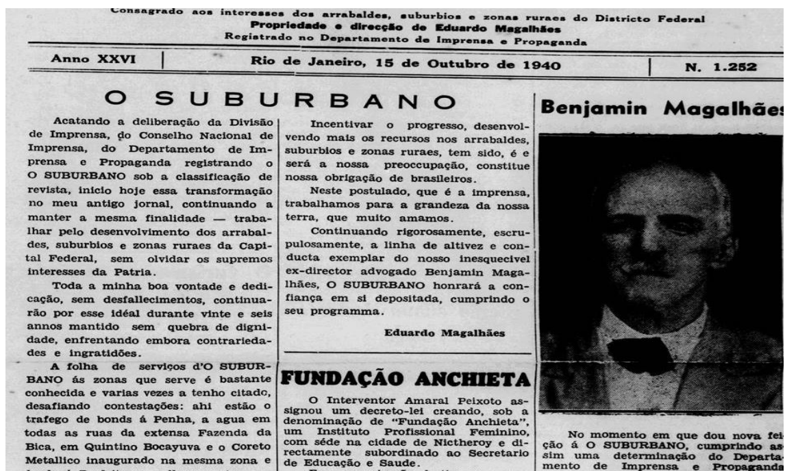
Imagem 05. Reportagem O Suburbano