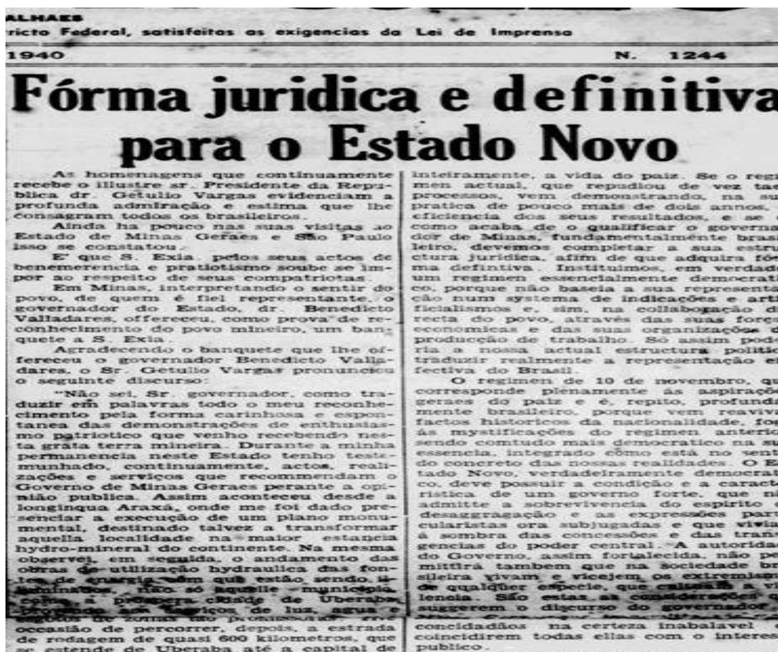
Imagem 04. Reportagem Forma jurídica e definitiva para o Estado Novo