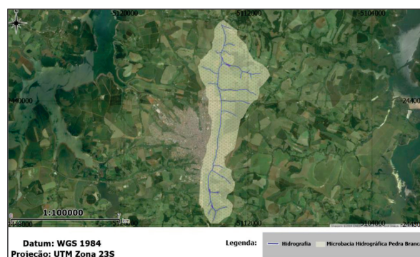
Figura 1: Microbacia hidrográfica do Córrego Pedra Branca localizado no município de Alfenas, Minas Gerais.

Amostras de água foram obtidas abaixo da lâmina d’água com garrafas de polietileno de 1000 ml para variáveis físicas e químicas. O acondicionamento e