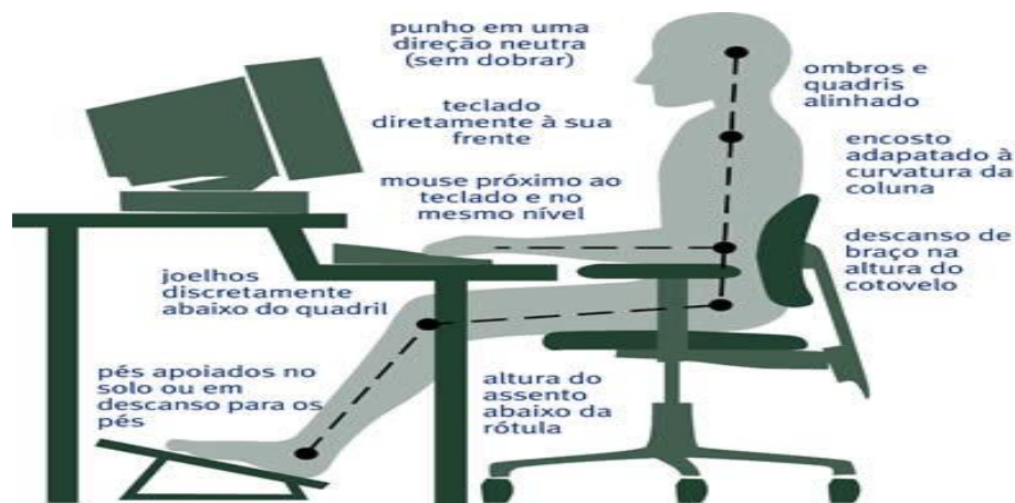
Figura 3 – Posto de Trabalho do Setor Secretaria Escolar

A seguir, é apresentada a situação atual através do Checklist para análise das condições do posto de trabalho.