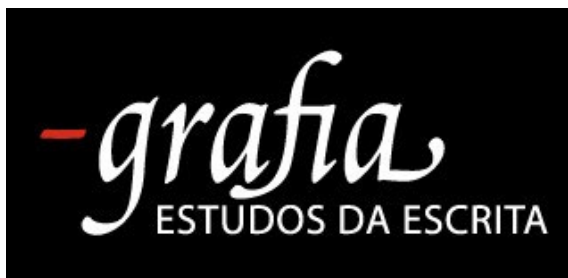
Figura 1: -grafia

-grafia : estudos da escrita, o nome do grupo, se apropria dos dois termos em questão, ainda com o traço, como se a marcar algo anterior à própria noção de grafia, além de indicar a ideia de composição de outras palavras, a partir do elemento -grafia , como na Figura 1. Liderado pelo professor Sérgio Antônio Silva, o grupo, criado em 2012, busca, desde o seu início, demarcar uma área de atuação – a dos estudos da escrita –, mantendo, porém, um arranjo multidisciplinar, com interseções nos estudos em design, estudos literários, estudos linguísticos, estudos editoriais, estudos filosóficos etc. Diante de certa amplitude de temas, a definição de linhas de pesquisa dentro do grupo ajuda a compor recortes mais ou menos especializados. Assim, o grupo, tal como organizado para registro no CNPq, com a devida certificação da Pró-Reitoria de Pesquisa e Pós-graduação da UEMG, possui quatro linhas: 1) estudos da escrita; 2) escutas da escrita; 3) caligrafia, tipografia e práticas editoriais e 4) patrimônio e memória gráfica (SILVA, 2022b).