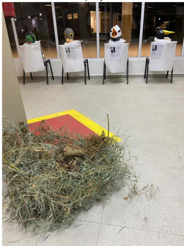
Figura 4 Exposição