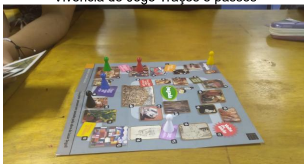
Figura 12 Vivência do Jogo Traços e passos