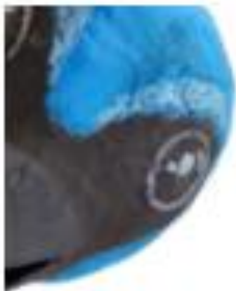
Figura 7 A obra que vê

Ao conectar a arte com outras disciplinas, abordamos temas complexos de forma mais significativa. Essa interconexão permite a construção de um conhecimento mais abrangente e contextualizado sobre a sua história, espelhando a cosmovisão das comunidades tradicionais.