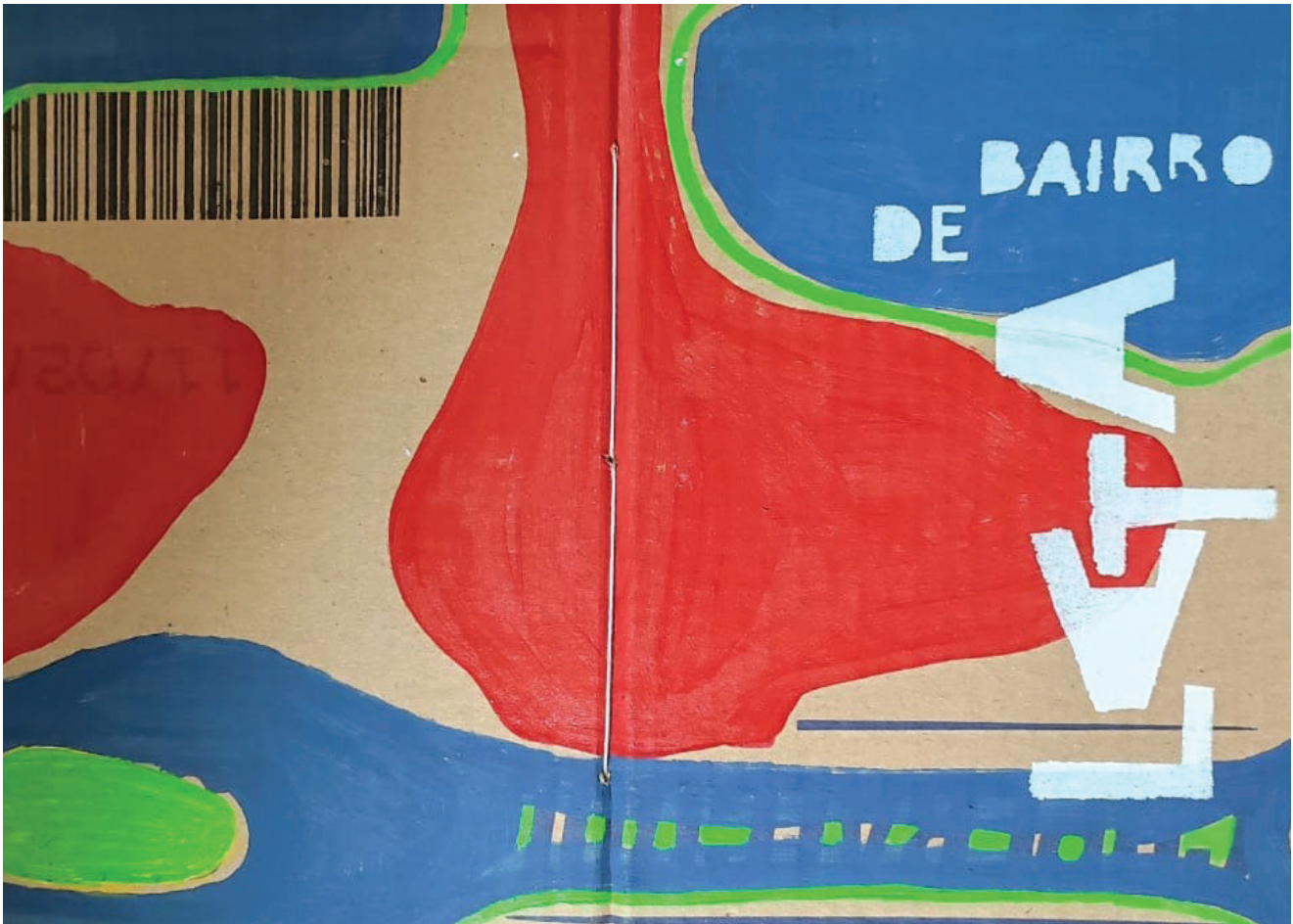
Figura 2: Vestígios de memórias na capa do livro “Bairro de Lata” do coletivo Dulcinéia Catadora.

O que foi rejeitado — o papelão, o resto, o lixo — retorna como elemento central do livro. O escatológico aqui não remete apenas à sujeira ou ao dejetivo, mas a um campo simbólico que recusa a hierarquia entre o nobre e o abjeto, entre o centro e as margens. Nesse sentido, a escatologia não marca um limite, mas abre uma dobra no tempo, onde o passado retorna transformado e o presente se torna espaço de invenção. O livro cartonero é, então, mais do que um artefato de resistência, é um corpo ritualizado que atualiza memórias e performa futuros possíveis.