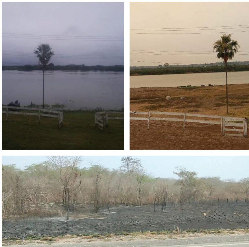
Figura 4: Registros na perspectiva crítica.