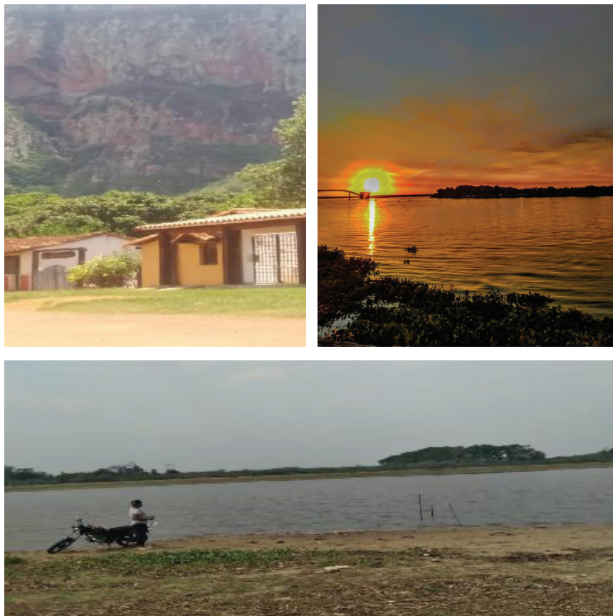
Figura 2: Registros na perspectiva conservadora.