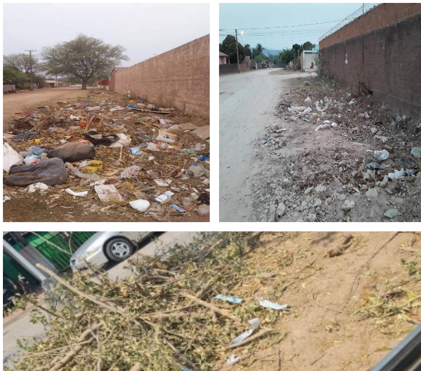
Figura 3: Registros na perspectiva pragmática.