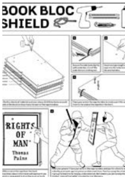
Figura 4 - Instruções para fazer o escudo de proteção.

grupo amplamente criticado por ações violentas e explosivas é uma potente ironia.