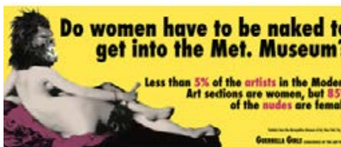
Figura 7 – Do Women Have to be Naked Met Museum? Poster do coletivo Guerrilla Girls, integrante da exposição.