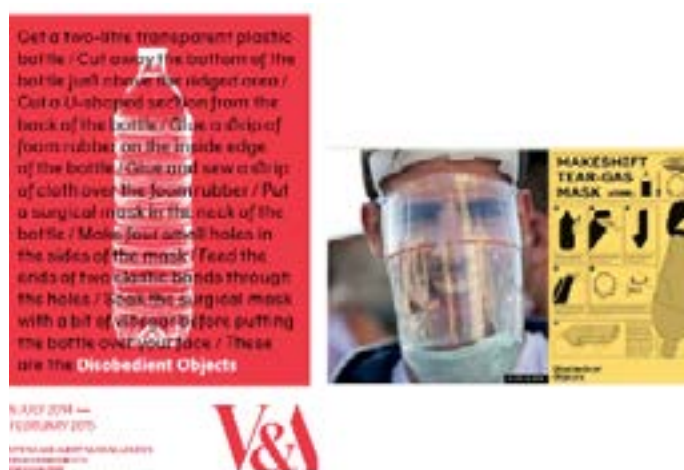
Figura 6 – Capa do catálogo e cartaz de divulgação; imagem de Jodi Hilton, presente na exposição; e PDF com instruções, distribuído na exposição.

Um dos principais símbolos da mostra estampa a capa do catálogo: instruções para fazer máscara protetora contra gases, com garrafa pet, espuma e vinagre (FIG 6). Além de disponíveis aos visitantes em papel impresso, o folheto estava liberado para download no website. Pequenos objetos como os bottons são celebrados, como estratégia de comunicação que favorece reconhecimento de parcerias e cumplidades. Trabalhos do coletivo de artistas feministas Guerrilla Girls são outro exemplo da aliança entre design gráfico e ativismo (FIG 7).