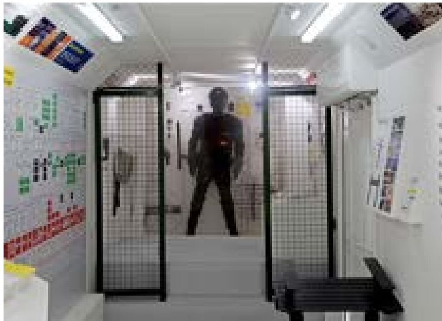
Figura 9 – Interior da exposição.