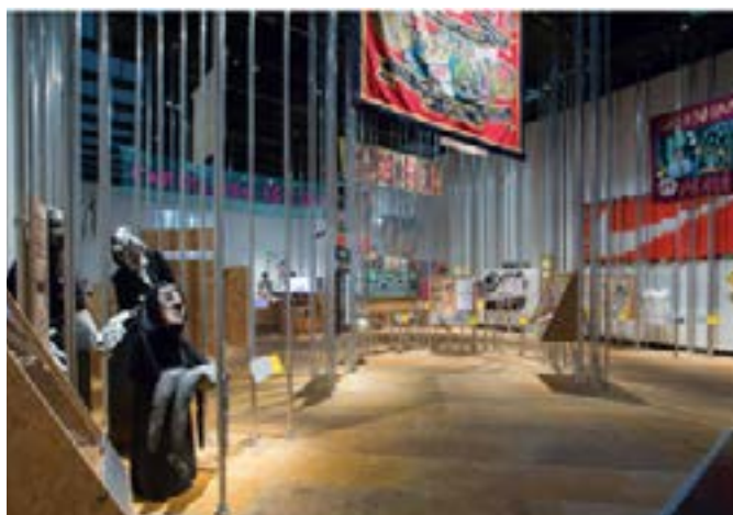
Figura 3. Uma das salas da exposição.