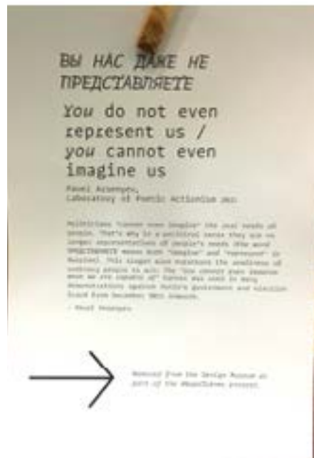
Figura 2 – Crédito de um dos trabalhos expostos. A seta indica a informação sobre a retirada do Design Museum .