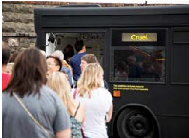
Figura 8 – Fila para adentrar o espaço expositivo.