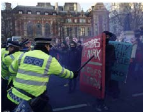
Figura 5 - Imagem da exposição: Book Blocs nas ruas de Londres, dezembro, 2010.