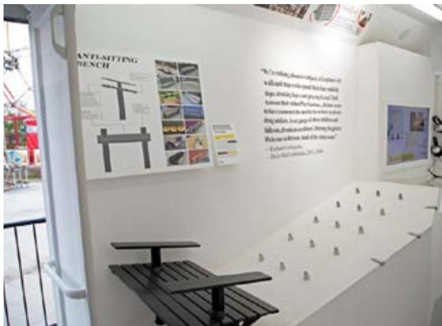
Figura 10 - Detalhe da exposição Cruel Designs : dispositivos anti-sem-teto.