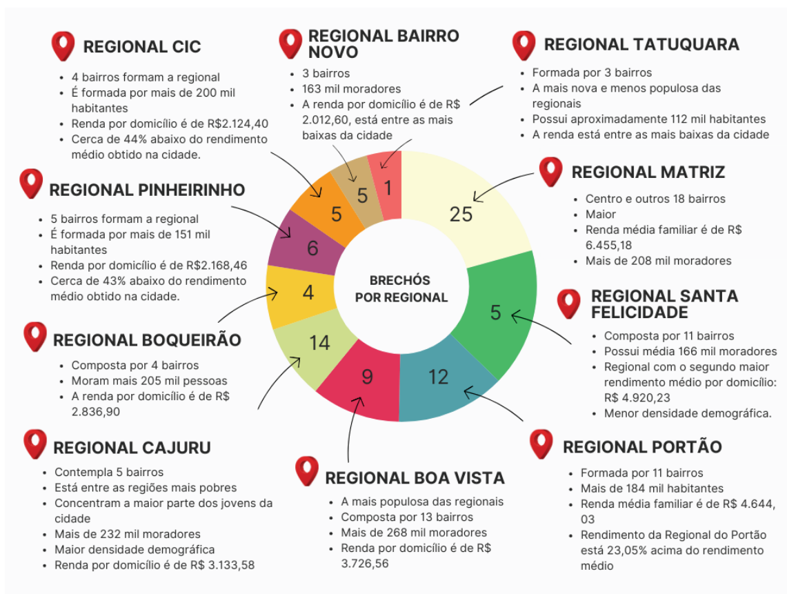
Figura 2 – Gráfico com dados populacionais e de renda.

Por fim, com base na fundamentação teórica apresentada, entende-se a economia circular como um caminho viável aos insustentáveis aspectos da economia linear. É de suma importância a mudança de mentalidade tanto dos planejadores públicos, na implementação de regulações sobre o tema, como também dos líderes empresariais, visto que o atual modo de extração e descarte de recursos e produtos está obsoleto. A pesquisa permitiu identificar os empreendimentos atuantes com meio da economia circular no segmento infantil na cidade de Curitiba/PR. Verificou-se, ainda, que o segmento de segunda mão tem sido promissor, visto o aumento da conscientização da população acerca da sustentabilidade e das práticas da economia circular.