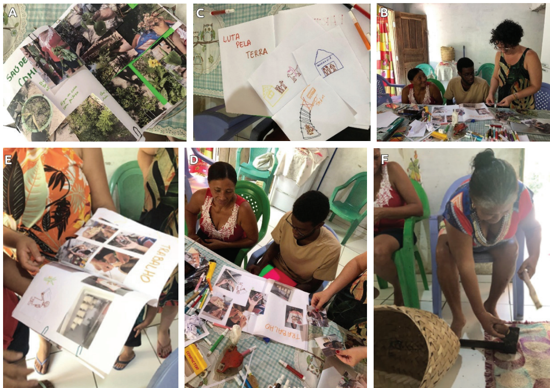
Figura 5 – Momentos de cocriação. (Imagens A, B, C, D, E e F): Elaboração do livro A história das mulheres de Monge Belo .

As narrativas que emergiram a partir do Cofo de Histórias e do livro A história das mulheres de Monge Belo são aqui apresentadas segundo os parâmetros da lacuna de gênero, sendo estas: saúde e bem-estar, acesso à educação, participação econômica e participação política.