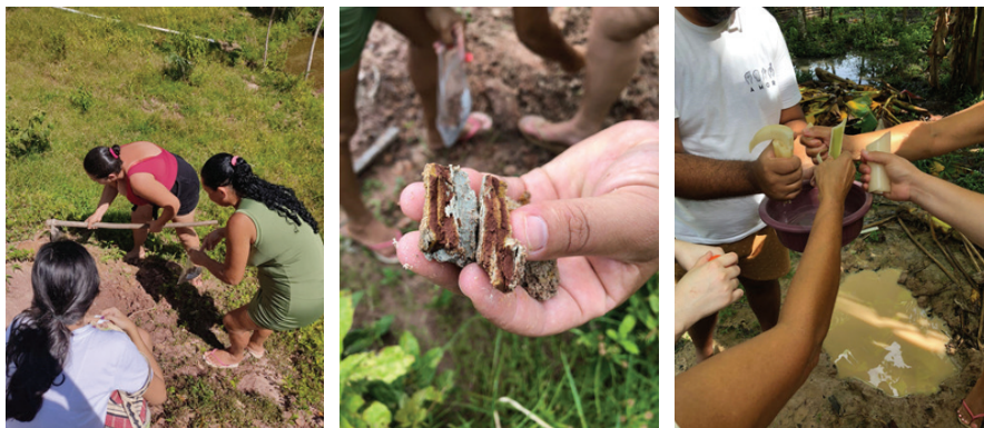
Figura 2 – (Imagens A, B e C): Busca no quilombo por matéria-prima para os processos de cocriação com colorantes naturais.

colorantes minerais eram procedentes do estado de Minas Gerais, desconsiderando as dimensões de sustentabilidade, em especial, a ambiental.