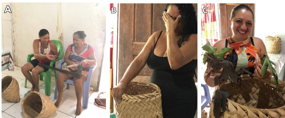
Figura 4 – Experienciando a prototipação. Mulheres usando o Cofa de Histórias.

Um ponto de relevância diz respeito ao fato de que o grupo de mulheres envolvido na atividade aumentou em relação ao dia anterior. As participantes encorajaram outras moradoras de Monge Belo a também partilhar suas histórias de vida (Figura 4), assim como fez a personagem Dijé (observando aqui uma validação do nosso processo). Cada uma das mulheres nos trouxe uma visão de diferentes períodos daquela localidade, devido à variação de suas faixas etárias (entre 30 a 60 anos). Apesar das variações de idade, todas elas são mães.