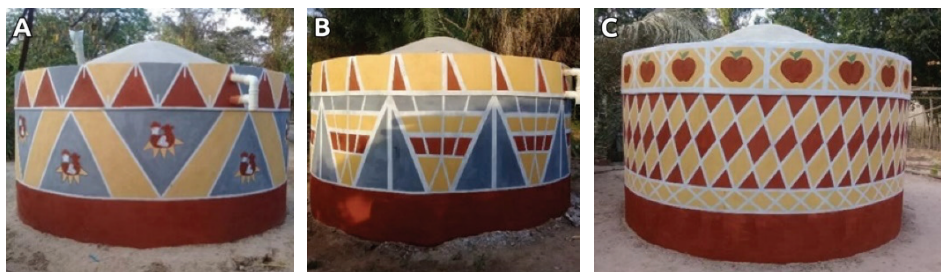
Figura 1 – Cisternas em Monge Belo.

A comunidade está localizada a 100 km da capital do estado do Maranhão, no município maranhense de Itapecuru Mirim, sendo necessário percorrer mais 12 km de estrada de terra para chegar até lá. A economia local configura-se como de subsistência, por meio do cultivo de grãos e do manejo de animais. A renda das famílias também é complementada por meio de auxílios fornecidos pelo Governo Federal e pelos trabalhos artesanais realizados pelas mulheres.