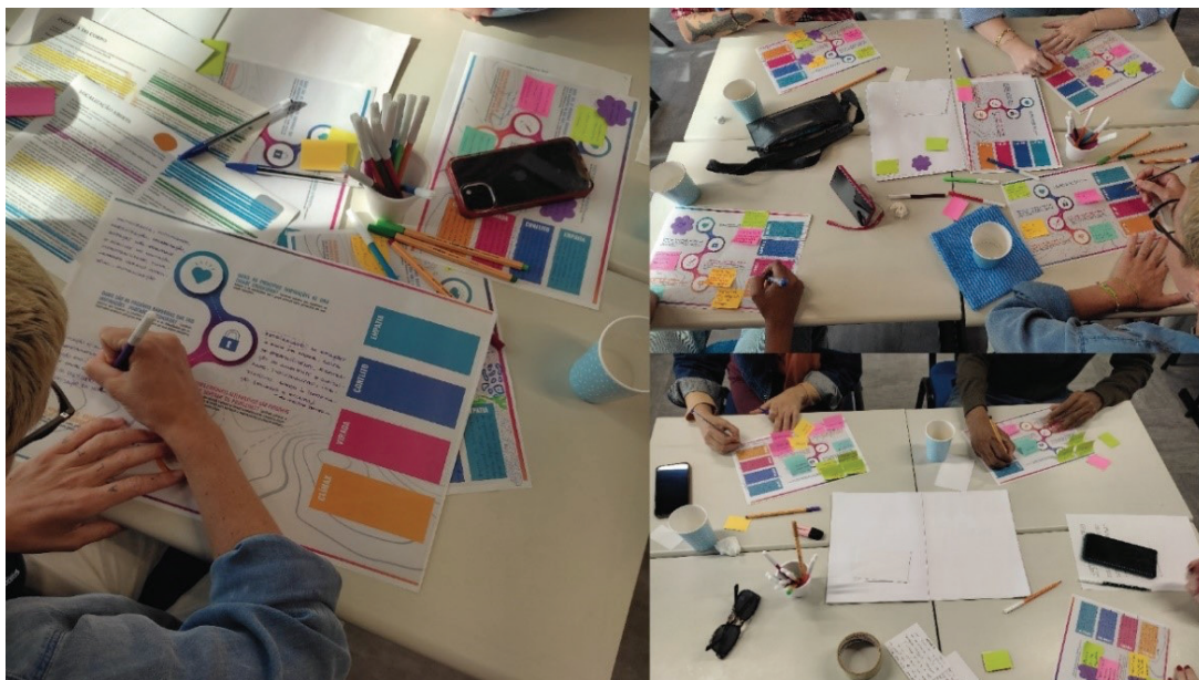
Figura 3 – Prototipação das narrativas cidadãs.

Foram realizadas duas oficinas para coleta das dez narrativas. Os cidadãos envolvidos nas duas oficinas possuem perfis distintos e podem ser caracterizados por meio das oficinas: