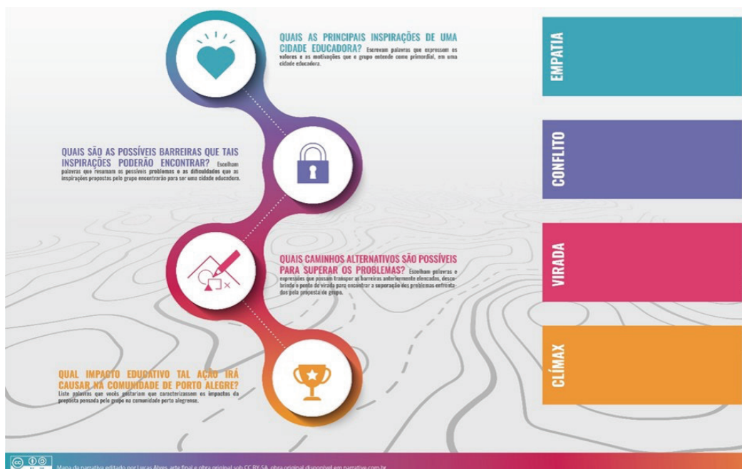
Figura 2 – Ferramenta “Mapa de Narrativas” impressa em A3.